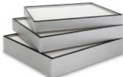
7. Megalam MX MG