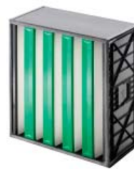
4. Absolute VG