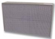
6. GigaPleat NXPP