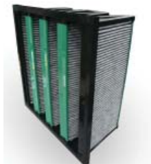
5. GigaPleat NXPH