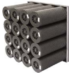
3. Cylindre CamCarb CG