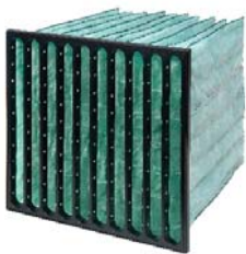
1. Hi-Flo XL F7/F8