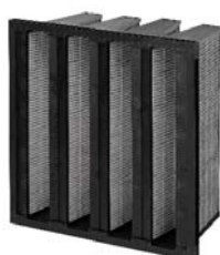
7. CityCarb F7