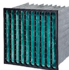
4. City-Flo XL