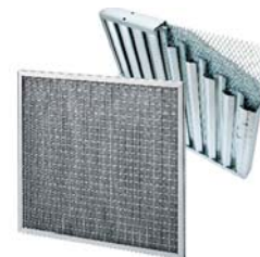
10. CamMet G3