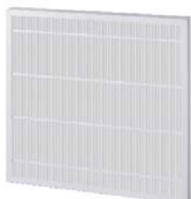
2. M-Pleat Green