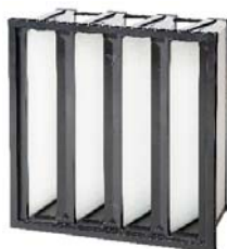
6. Opakfil ES F7