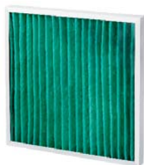
1. AeroPleat Green