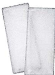
3. Ventilo Convecteur