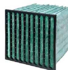
5. Hi-Flo XLT