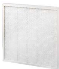
8. EcoPleat Green