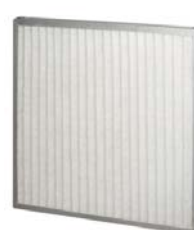
9. CamPlan CS G4