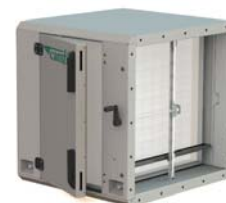
4b. CamCube AS