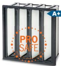
1. Opakfil ProSafe ES F7