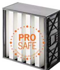
3. Absolute ProSafe H13