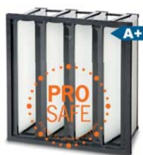
2. Opakfil ProSafe ES F8