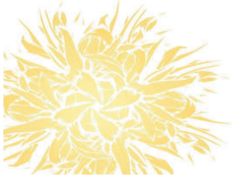
Table ronde 3