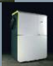
Pompe à chaleur Air/Eau