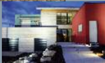
Vue d'ensemble de la maison "Moysse" de nuit