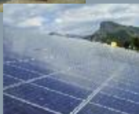
Toiture acier solaire photovoltaïque