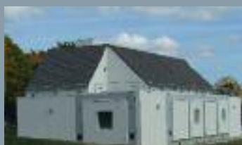
EDF R&D - BESTLab : laboratoire de test de systèmes solaires et d'enveloppes de bâtiment

Par la qualité de ses équipes, ses capacités de R&D, son savoir-faire dans les productions nucléaire, thermique et d'origine renouvelable, à commencer par l'hydraulique, par ses offres d'efficacité énergétique, il apporte des solutions compétitives pour concilier durablement développement économique et protection du climat.