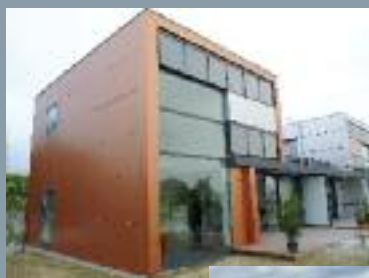
Villavenir maison acier

Par ailleurs, ArcelorMittal promeut une culture de l'acier "Sain" et "Durable" ("Safe Sustainable Steel").