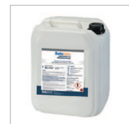
SoluTECH LESSIVAGE ET DÉSEMBOUAGE