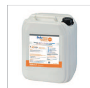
SoluTECH PROTECTION INTÉGRALE