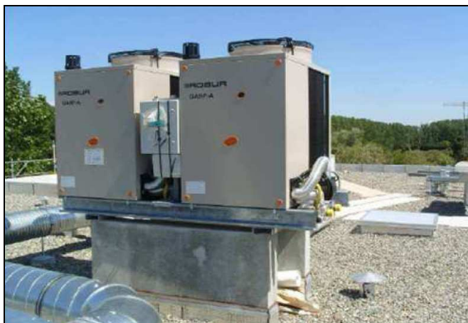
Figure 1 : Les deux PAC installées en toiture terrasse

Le suivi météorologique de l'installation permet de mesurer les consommations de gaz naturel et d'électricité consommée ainsi que la production de chauffage associée.