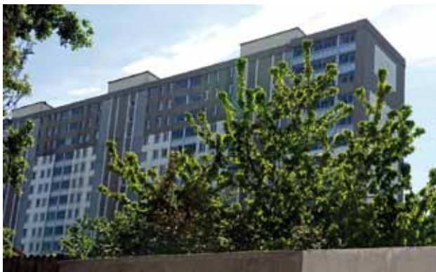
L'Anah participe à l'aide à la rénovation des logements de plus de 15 ans, à la lutte contre la précarité énergétique, à l'amélioration des copropriétés dégradées...

L'Anah participe également au développement d'une offre de logements privés à loyers et charges maîtrisés .