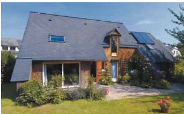
Isoler votre toit! 25 à 30 % de la chaleur s'échappe par la toiture.