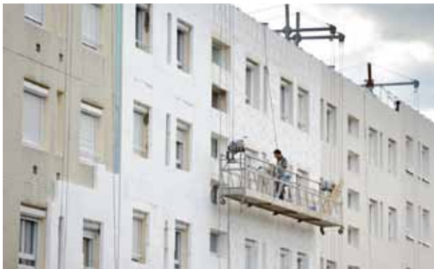
Les travaux pour l'amélioration de l'efficacité énergétique des logements peuvent donner lieu à des prêts intéressants.

Si vous percevez des allocations familiales et sous conditions de ressources, vous pouvez bénéficier de ce prêt qui concerne, entre autres, les travaux d'amélioration et d'isolation thermique . Il peut couvrir 80% de leur montant (montant plafonné). Pour plus d'informations, adressez-vous à votre caisse d'allocations familiales (CAF).