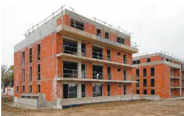
En 2014, les aides financières encouragent la construction de logements très économes en énergie.

Le prêt à taux zéro+ est réservé aux logements respectant la réglementation thermique 2012.