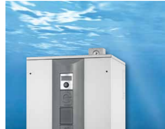
La pompe à chaleur Eau / Eau WWC 440X

Les appareils de type WWC sont dotés du régulateur Luxtronik 2.0. Fonctions : programme de préchauffage de chape, minuterie intelligente, fonction de charge rapide d'Eau Chaude Sanitaire, port USB (pour lire les données), interface de réseau (avec un navigateur internet, un commande sur le réseau domestique est possible sans hardware ou software additionnels) etc.