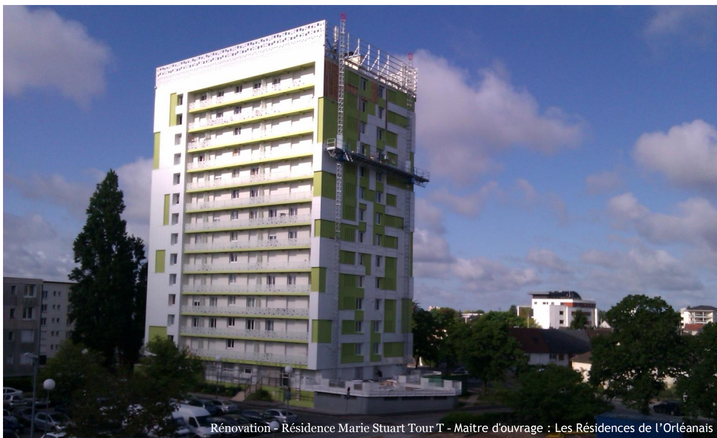
Rénovation - Résidence Marie Stuart Tour T - Maitre d'ouvrage : Les Résidences de l'Orléanais