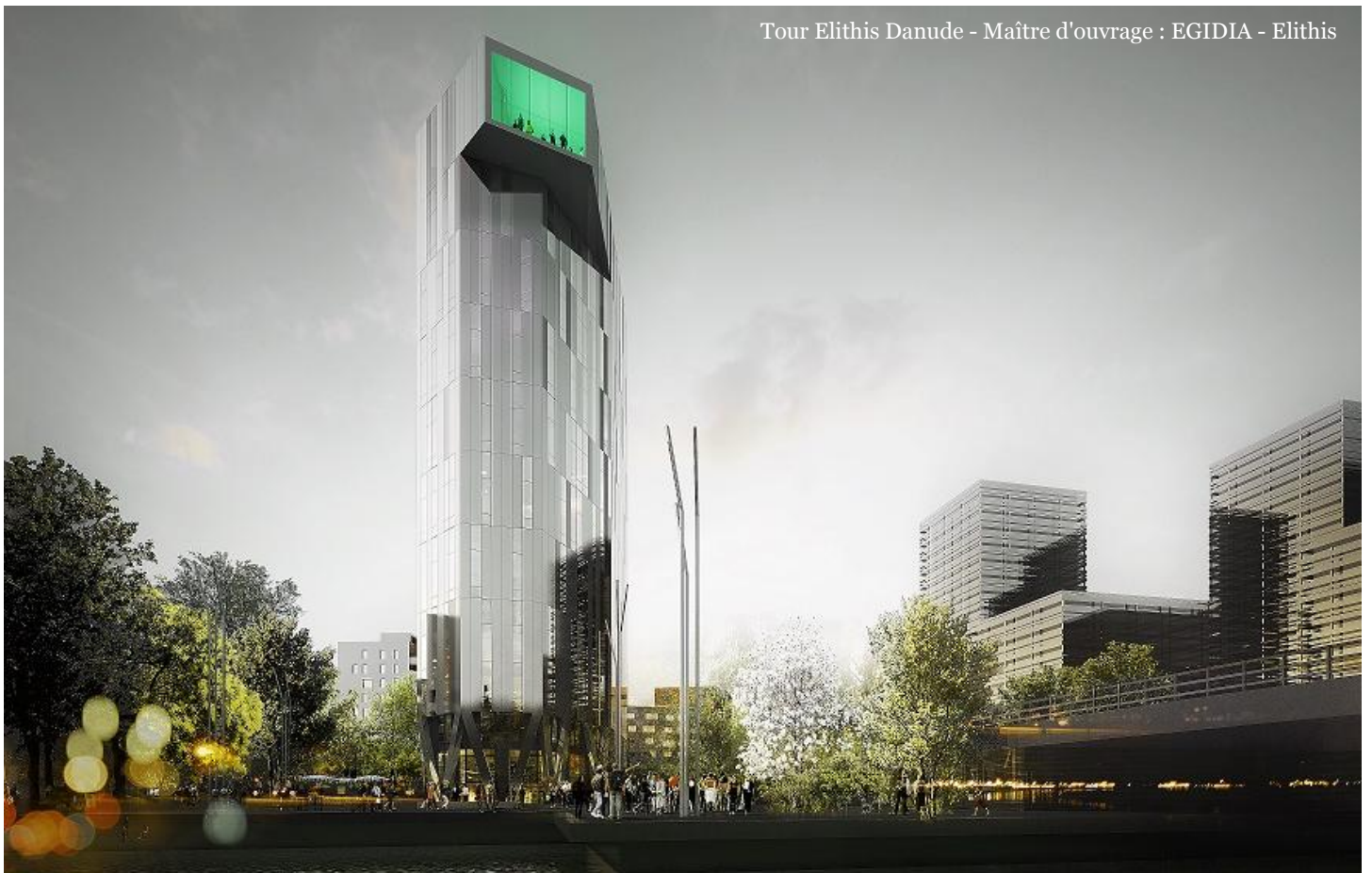
Tour Elithis Danude - Maître d'ouvrage : EGIDIA - Elithis